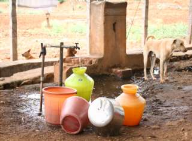
Situation d'un point de distribution d'eau avant l'intervention de Kynarou dans un village du projet

Des sessions de prévention et d'éducation sont organisées par Kynarou et son partenaire CWD pour les enfants, les adolescents et les adultes (surtout les femmes). Nous conduisons aussi des représentations théâtrales dans les villages ainsi que de l'art mural afin de communiquer les bonnes pratiques d'hygiène aux populations cibles.