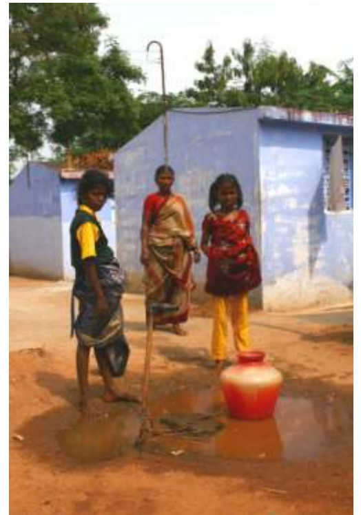
En attente d'eau autour d'un point de distribution d'eau dans un village du projet

La gestion des infrastructures est d'abord prise en charge par le comité de gestion et Kynarou. Ce comité est responsable de la maintenance du réseau d'assainissement et de la mobilisation de la population. Un ingénieur de notre partenaire local CWD travaille au suivi technique en collaboration avec Kynarou. Nous assurons ainsi une gestion raisonnée du projet.